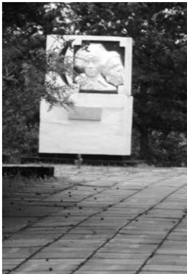
На Бульгинском кладбище в Барнауле